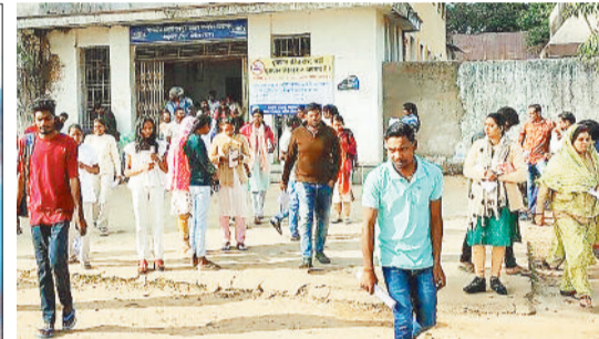
परीक्षा देकर बाहर निकलते परीक्षार्थी।

महाविद्यालय में एक परीक्षार्थी फुल आस्टीन की शर्ट पहनकर तब आया, जब परीक्षा केन्द्र में प्रवेश के लिए 5 मिनट ही शेष बचे थे, तब परीक्षार्थी ने अपनी शर्ट खोलकर परीक्षा कक्ष में प्रवेश किया। इसी तरह व्यापम के निर्देशों का पालन करते हुए सभी परीक्षा केन्द्रों में निर्धारित समय से